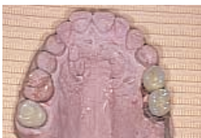
7 Se fabricaron dos coronas de metal-porcelana.