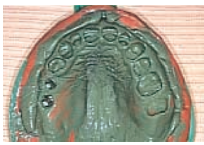
5 Impresión con el material de impresión 3M Express con las cofias en su lugar.