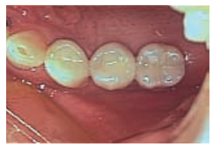
9 Vista oclusal de la prótesis (segunda bicúspide y primer molar).