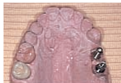
6 Pilares de prótesis en el modelo maestro.