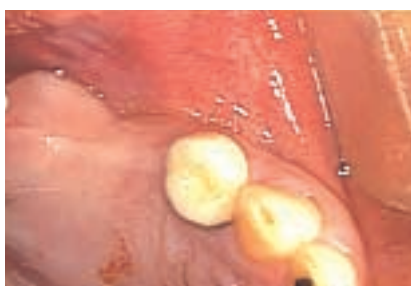
2 Después de las extracciones, los tejidos blandos muestran buena salud.