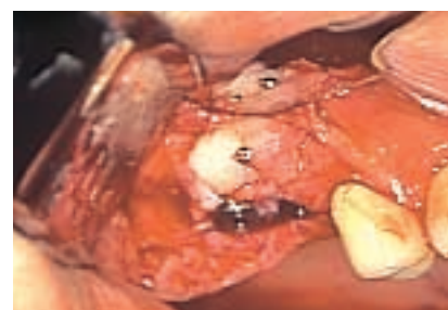
3 Colocación de dos implantes de titanio, reemplazando la bicúspide superior izquierda (4.0 mm) y el primer molar superior izquierdo (5.0 mm, wide angle).