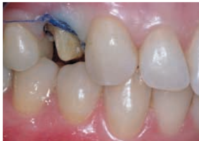
2 Se utilizó hilo de retracción para mejorar el acceso subgingival y controlar los fluidos en el surco.