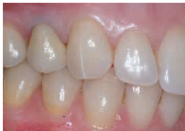
4 Se construyó en el laboratorio una corona de metal-porcelana que fue colocada con cemento RelyX Luting. El exceso de cemento se eliminó después del fraguado.