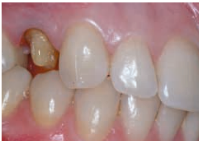
1 El primer premolar se preparó para una corona de metal-porcelana. El tejido residual fue suficiente para proveer una retención adecuada.

Materiales: 3M™ ESPE™ Single Bond Adhesivo Dental 3M™ ESPE™ Express™ Material de Impresión 3M™ ESPE™ RelyX™ Luting