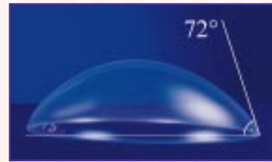
Figura A. Una gota de agua sobre el Material de Impresión 3M™ ESPE™ Impregum™ no polimerizado. El ángulo pequeño es debido a la hidrofilicidad inicial.

El material de impresión Impregum puede ser almacenado hasta 14 días sin la necesidad de confección del modelo de yeso de forma inmediata. Puede usted vaciar las impresiones de Impregum cuando le sea conveniente. Si usted lo requiere, las impresiones de Impregum pueden ser vaciadas varias veces.